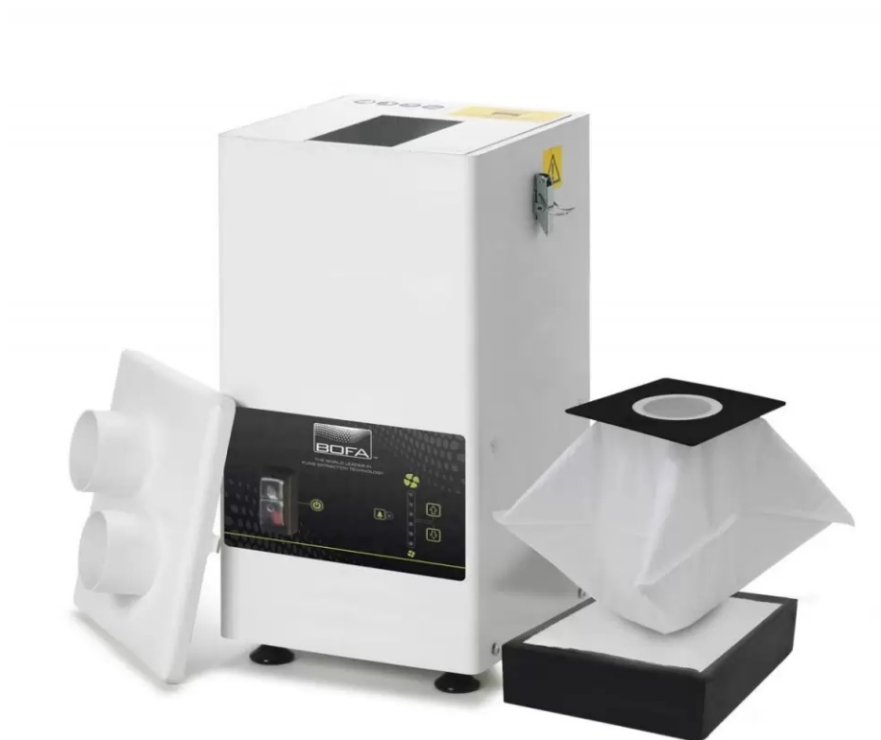
BOFA DustPRO 400 s filtrami

Výrobky spoločnosti BOFA - patria k svetovej špičke v oblasti technológií odvodu splodín vznikajúcich napr. pri laserovom označovaní a gravírovaní, ako aj pri iných výrobných procesoch, pri ktorých vznikajú splodiny, dym, prach, malé častice, škodlivé a nebezpečné pre pracovníkov ale aj pre technické zariadenia.