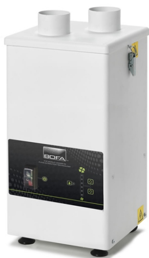
BOFA DustPRO 400