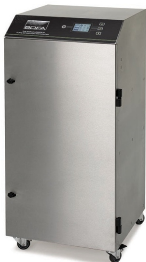
BOFA AD Oracle iQ