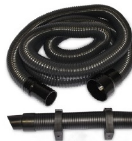
sada odsávacích hadíc 75-50 mm

Výrobky spoločnosti BOFA - patria k svetovej špičke v oblasti technológií odvodu spodín vznikajúcich napr. pri laserovom označovaní.