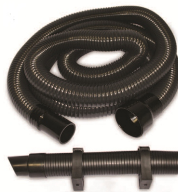
sada odsávacích hadíc 125 - 100 mm

Výrobky spoločnosti BOFA - patria k svetovej špičke v oblasti technológií odvodu spodín vznikajúcich napr. pri laserovom označovaní.