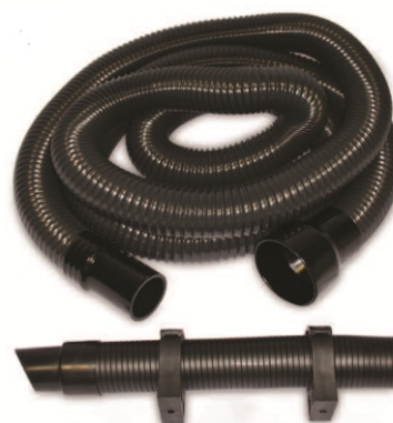
sada odsávacích hadíc 125 - 100 mm

Výrobky spoločnosti BOFA - patria k svetovej špičke v oblasti technológií odvodu spodín vznikajúcich napr. pri laserovom označovaní.