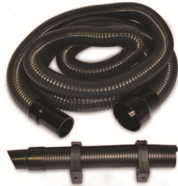
sada odsávacích hadíc 125 - 100 mm

Výrobky spoločnosti BOFA - patria k svetovej špičke v oblasti technológií odvodu spodín vznikajúcich napr. pri laserovom označovaní.