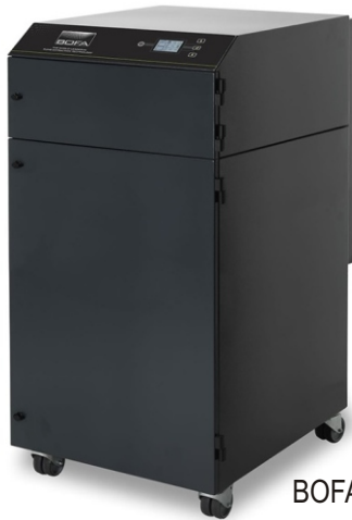
BOFA AD 1000 iQ