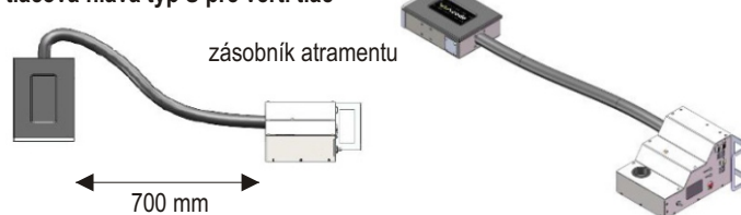
tlačová hlava typ S pre vert. tlač

K uľahčeniu inštaláčnych obmedzení je možné nastaviť dĺžku a šírku tlačovej hlavy natočením nádrže s atramentom o 0-180°.