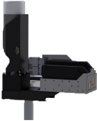
veľkoobjemový atramentový systém