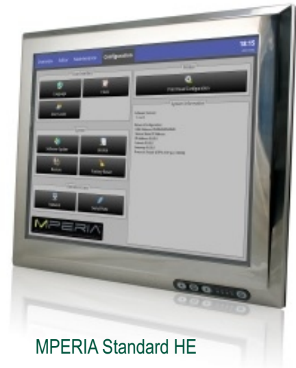
MPERIA Standard HE