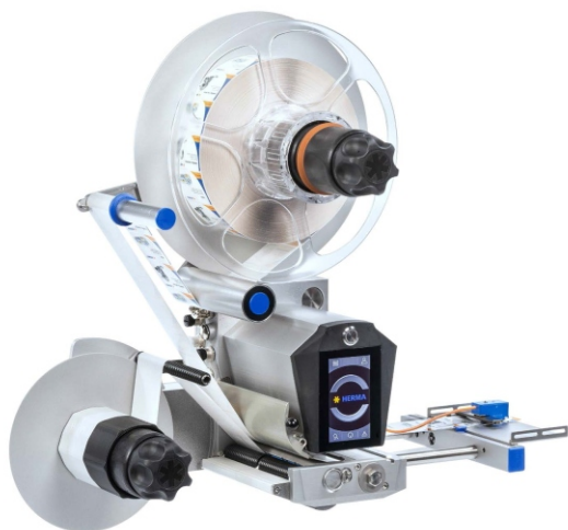
HERMA 500 - aplikátor etikiet