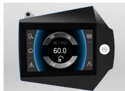
4,3" dotykový polohovateľný displej

Aplikátor Herma 500 je výsledkom spoločnosti Herma, ktorá existujúci aplikátor Herma 400 zdokonalila, zvýšila rýchlosť, konektivitu a spoľahlivosť.