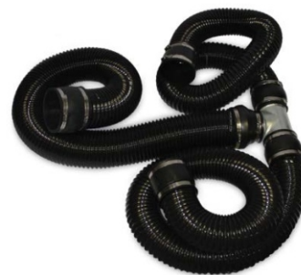
sada odsávacích hadíc 100-100 mm

Výrobky spoločnosti BOFA - patria k svetovej špičke v oblasti technológií odvodu spodín vznikajúcich napr. pri laserovom označovaní.