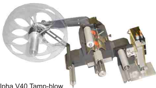
Alpha V40 Tamp-blow

Funkcia zálohovania ovládacej jednotky (voliteľná) umožňuje kopírovať všetky premenné hodnoty (napr. parametre etikiet) ľahko a spoľahlivo prostredníctvom sériového rozhrania do záložnej ovládacej jednotky. Je možné konfigurovať aj vstupy snímačov. Produkty nepravidelného tvaru môžu spôsobiť nežiadúce niekoľkonásobné signály, tieto signály je možné eliminovať. Voliteľné prvky, napríklad kódovač polohy, výstražné kontrolky, snímače a pod.) je možné namontovať dodatočne s využitím funkcie Plug & Play Systém Alpha V40 je k dispozícii v nasledujúcich verziách: Wipe-on, Tamp-on, Tamp-blow a Blow-box. To znamená, že je možné splniť požiadavky na väčšinu aplikácií etikiet pomocou jediného modulárneho systému.