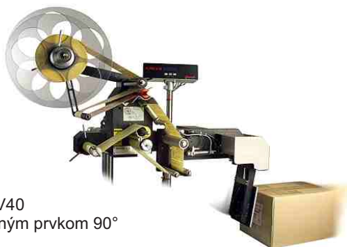
Alpha V40 s rotačným prvkom 90°